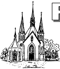
St. Mariä Heimsuchung Hehn