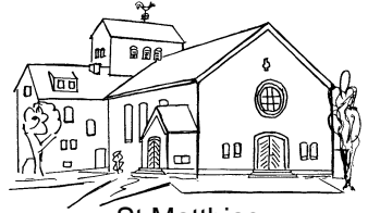
St. Matthias Günhoven