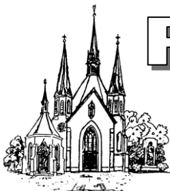
St. Maria Heimsuchung Hehn