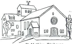
St. Matthias, Günhoven