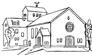
St. Matthias Günhoven

www.mg-hehn.de - Nummer 06/2010 – Dezember 2010 / Januar 2011