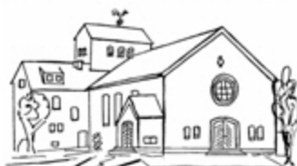
St. Matthias Günhoven

www.mg-hehn.de - Nummer 07/2008 – Dezember 2008 / Januar 2009