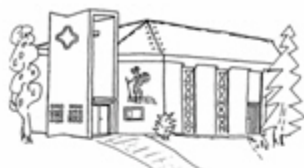
St. Christophorus Dorthausen