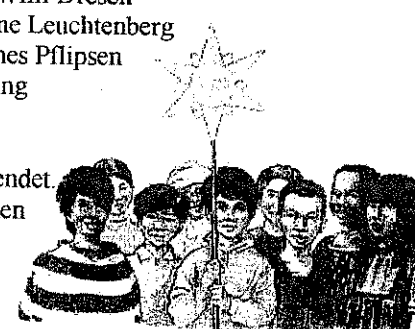
DAMIT KINDER LEBEN KÖNNEN