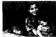
„Die Armut in Esmeraldas ist enorm. Viele Väter verlassen ihre Familien – für einen besseren Job in einer anderen Gegend oder für eine andere Frau. Nicht wenige Kinder werden misshandelt.“

Nächster Termin für Pfarrbriefmitteilungen: 16.01.2001.